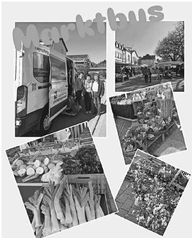
Impressionen unseres Marktbus-Ausflugs

Bitte beachten: Die Sitzplätze sind begrenzt!