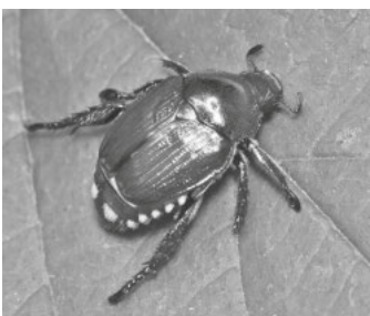
Erkennen kann man den rund einen Zentimeter großen Japankäfer an seinen fünf weißen Haarbüscheln an jeder Seite und zwei weißen Haarbüscheln am Ende des Hinterleibs

Der Japankäfer ist lediglich einen Zentimeter groß, hat eine metallisch grüne Färbung und auffällige weiße Haarbüschel an den Seiten (fünf weiße Haarbüschel an jeder Hinterleibsseite und zwei weiße Haarbüschel am Ende des Hinterleibs). Die Larven des Käfers schädigen vor allem Wiesen und Rasenflächen durch Wurzelfraß. Die erwachsenen Käfer fressen an Blättern, Blüten und Früchten von über 300 verschiedenen Pflanzenarten, darunter Zier-, Obst- und Kulturpflanzen. An den Pflanzen bleiben oft nur die Gerippe der Blätter zurück. Betroffen sind unter anderem Beeren, Obstbäume, Weinreben oder Mais, aber auch Rosen und Bäume, wie Ahorn, Buche oder Eiche. Durch den Fraß werden die Pflanzen stark geschwächt oder sterben ab. Der Japankäfer wurde deshalb von der EU als sogenannter prioritärer Unionsquarantäne-schädling eingestuft – also als ein besonders gefährlicher Schädling. Seine Ansiedlung und Ausbreitung gilt es folglich zu verhindern oder einzudämmen.