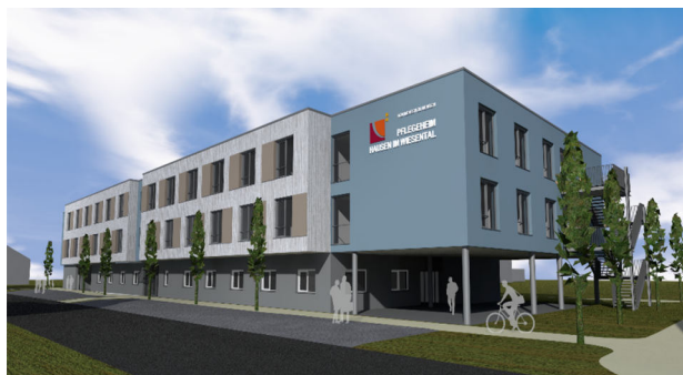
Entwurf Pflegeheim Hausen i. W.