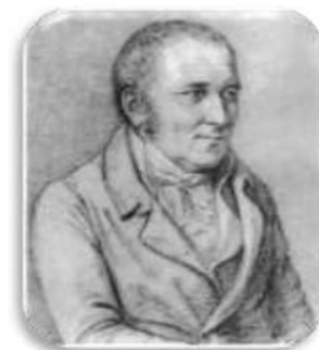
J. P. Hebel (1760 bis 1826)

Die Reformation brachte in Baden große Veränderungen: