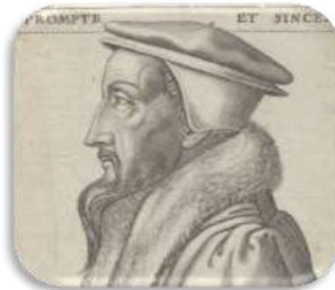
Johannes Calvin (1509 bis 1564)