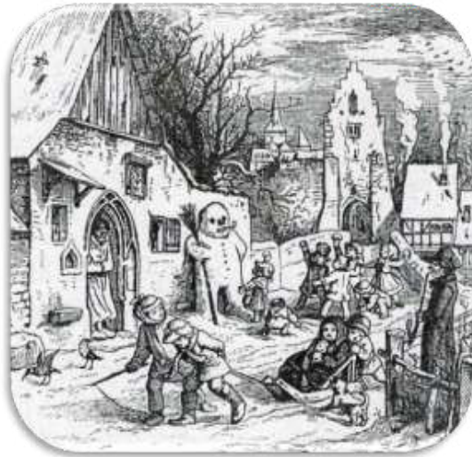
„Der Winter“ Holzschnitt von Ludwig Richter (1803 bis 1884)