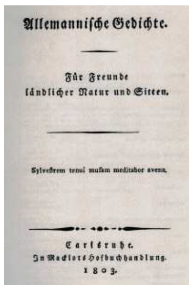
Titelblatt der Erstausgabe der „Allemannischen Gedichte“ Hebels, Macklot, Karlsruhe, 1803

Johann Peter Hebel und die Muttersprache