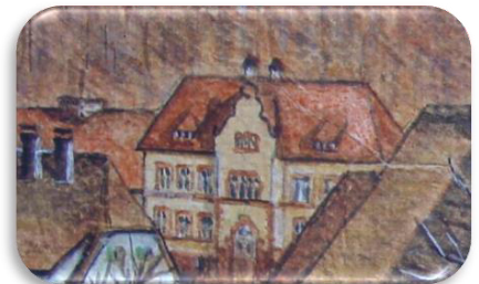
Aquarellbild (Ausschnitt) von Viktor Rosetti (1913 bis 2004)