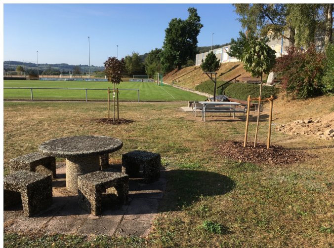
Grillplatz mit den zwei gepflanzten Ahornbäumchen