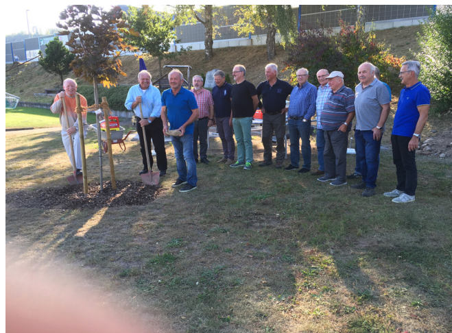
FC Hausen Oldies : Immer noch eine aktive Truppe