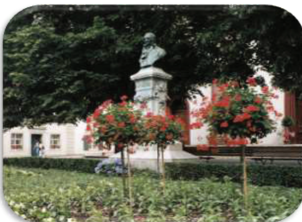
Hebeldenkmal vor der Peterskirche in Basel

Literatur: „Lebendiger Hebel – Hundert Jahre Basler Hebelstiftung 1860 – 1960“, verfasst von Otto Kleiber.