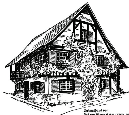
Heimatort von Johann Peter Hebel (1760-1826)