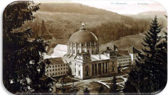
Porträt von Martin II. Gerbert in der Allgemeinen Deutschen Bibliothek, um 1785, von Egid Verhelst d. J. (1733 bis 1804), gemeinfrei, und Ansichtskarte des Klosters St. Blasien

Wer denkt bei der Geschichte des Klosters St. Blasien nicht sofort auch an Fürstabt Martin II. Gerbert (1720 bis 1793), als dessen Abt und Theologen, dessen Wirken und Handeln mit der Abtei St. Blasien untrennbar verbunden ist?